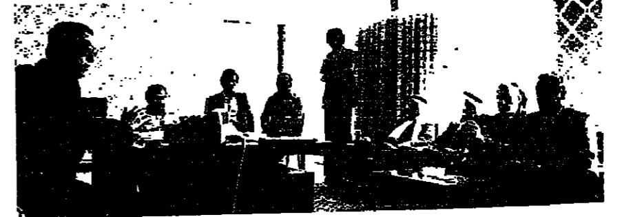
المحافظ بالوكالة مع وفد المزارعين ورئيس النقابة